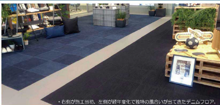
・右側が施工当初、左側が経年変化で独特の風合いが出てきたデニムフロア。

本紙VOL-29でも掲載させていただきました 【デニムフロア】田島ルーフィング株式会社が 2018年度グッドデザイン賞を受賞しました。