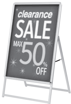
B1 片面 シルバー