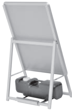
B2 片面 シルバー裏側