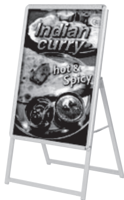
A1 片面 シルバー

※ RENEWAL が付いたモデルのみとなります。それ以外は従来通りのデザインとなります。