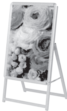
B2 片面 シルバー