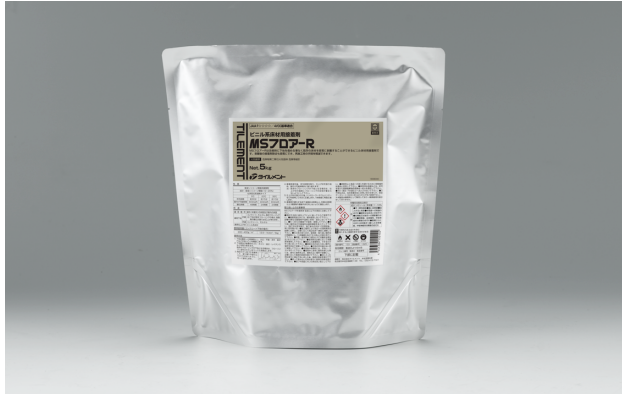
変成シリコン樹脂系接着剤

MSフローア-Rは改修時に下地を傷める事なく既存の床材を容易に剥離することができるビニル系床材用接着剤です。剥離後の接着剤除去も容易にでき、再施工時の手間を軽減できます。